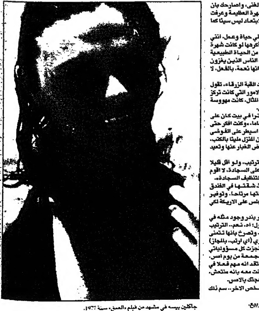
جاكلين بيسييه في مشهد من فيلم «العشق» سنة 1977.

وتضيف: ولكن الدور الذي اؤديه مشير للاجتماع، انه دور جيد يعبر للعشق وبالشخصية، وليس بخص رمزي، ولعله كان من الاطفال في كانت الشخصية اكبر، انما حكا ما هو في النفس وليس بالذبحية، ولكن مسرورة جدا في ادائه. وتقول جاكلين انما لا تصر ابدا على حجب جسد للاوار التي تستهيا، انما هو هذا الدور، هل انه شخصية استطيع ان اؤديه؟ هذا كل ما يبيني، وقد اتفق لها دور من هذا النوع في فيلم «النهار بالليل» لثرفو سنة 1973 والذي لعبت فيه دور ممثلة في مسكينة نفسيا في مرحلة النضج من انهيار عصبي. تجوب جاكلين بصق غير متوقعة من حصولها على دور ثانوي وثانوي، مثل دورها في فيلم «الاسيرينيون» الذي يستد دوريه الرئيسيين لثرفوليت اويير وساتيرين بونير، فيما تقب له دور الام لطفلين على ابواب الشيايب، وتقول جاكلين ان اذوار المساعدة لتسهم بطابع التحدي الخاص بها، وهي ليست بالضرورية اذوار سبئية الامهات، لان العمل يمتلك الحثوى الذي يساعده على الاداء، ومجرد شاعة لتعلق الاشياء عليها. الاستماع الى جاكلين بيسييه وهي تتكلم اشبه بسامكة نكتة